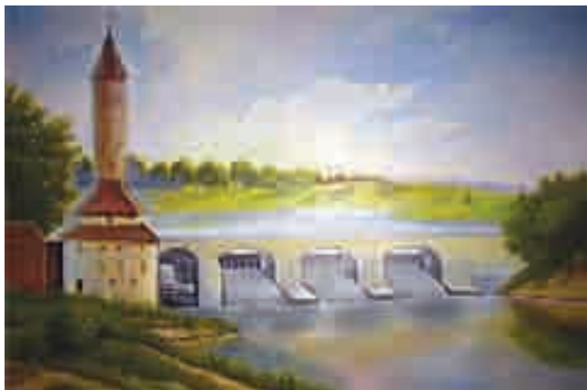
Цареборисовская плотина в с. Коломенском

Царицынская плотина, постоянно разрушавшаяся паводками, впервые была перестроена в 1776 г. по проекту архитектора К.Бланка. Предполагалось, что плотина на «аглинском» пруду будет перестроена «с прибавкой против прежней в две сажени шире» с внутренним берегом, облицованным белым камнем вместо деревянного обрuba; предполагалось также перенести на другое место мельницу, стоявшую у пруда. В 1795 г. архитектор И.К.Герард представил проект строительства новой плотины, в объяснении указав, что «при украшении плотины подражал аглинскому вкусу тамошних садов, а при мостах и мельнице готическому». В период царствования Павла I плотина была уничтожена весенним паводком, пруд на несколько лет зарос травой и стал сенокосным лугом.