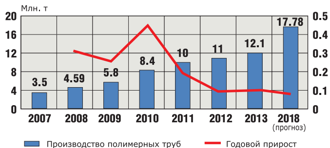
Рис. 1. Производство полимерных труб в Китае [1]