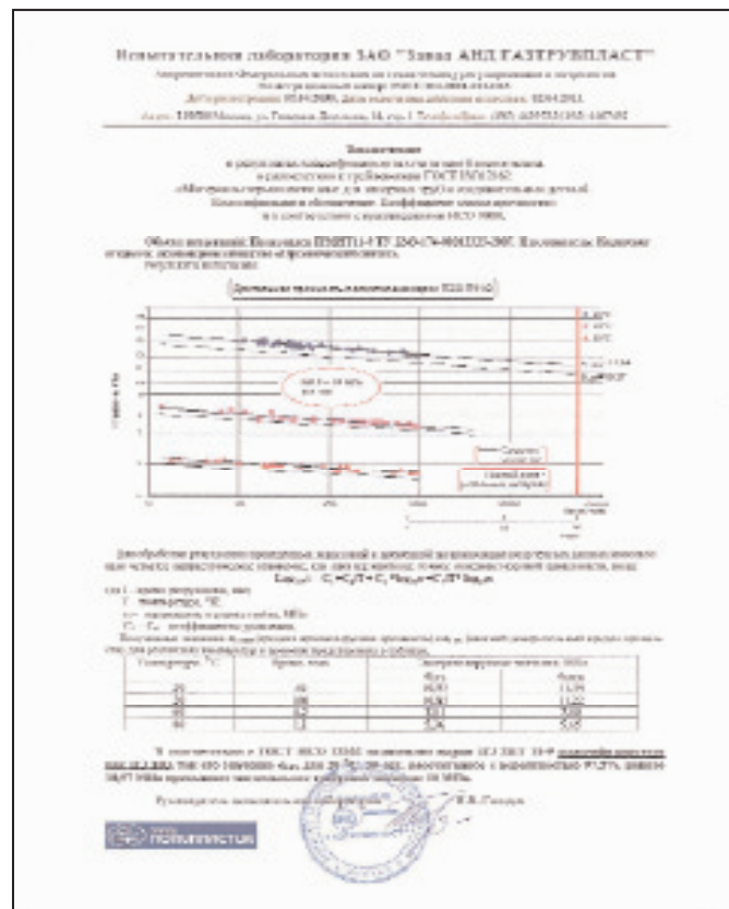
Рис. 1. Заключение о результатах классификационных испытаний трубной марки полиэтилена

Для расчёта температурно-временной зависимости прочности многослойных труб используются отдельные стандарты, как например стандарт ISO 17456:2006 “Multilayer plastics pipes. Determination of the long-term